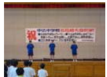
北信越大会壮行会 横断幕は同窓会が 準備していただきました