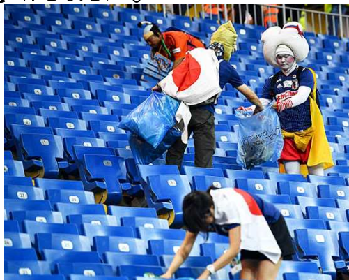
<試合後にゴミ拾いをするサポーター>

更に日本人サポーターが競技スタンドのゴミ拾いをしている姿も世界に紹介されました。サポーターの皆さんは、試合に負けて悔しくて泣きながらゴミ拾いを続けたそうです。ぜひ、選手も応援の皆さんも明日はこの様な素敵な1日になればと思います。